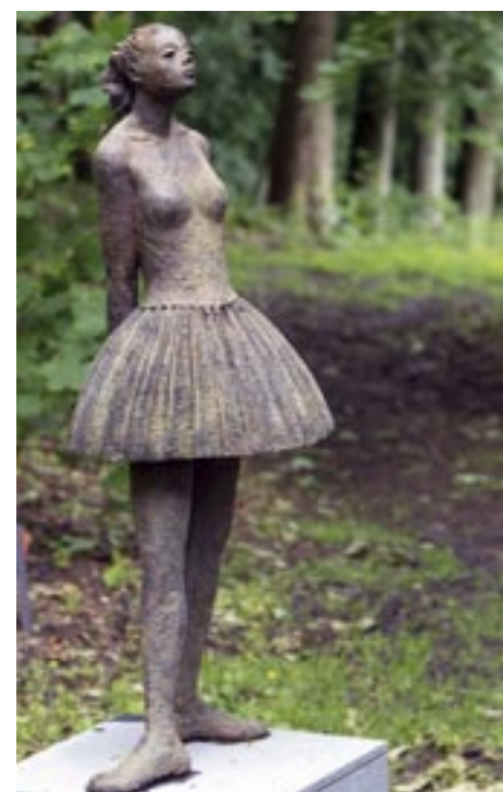
'HOMMAGE A EDGAR DEGAS'