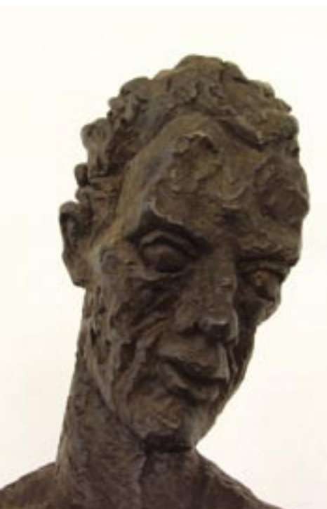
'VERWERPING'