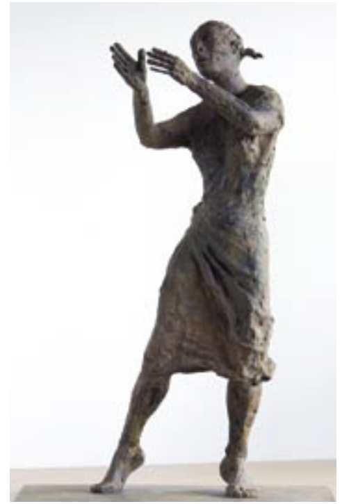
'DANSERES MET VLECHTJES'